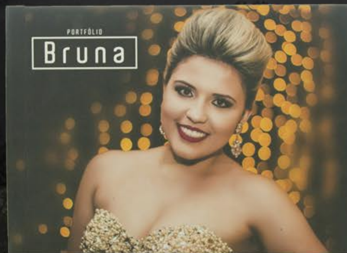
LUXO 25 X 70 CM (ABERTO) 25 X 35 CM (FECHADO)