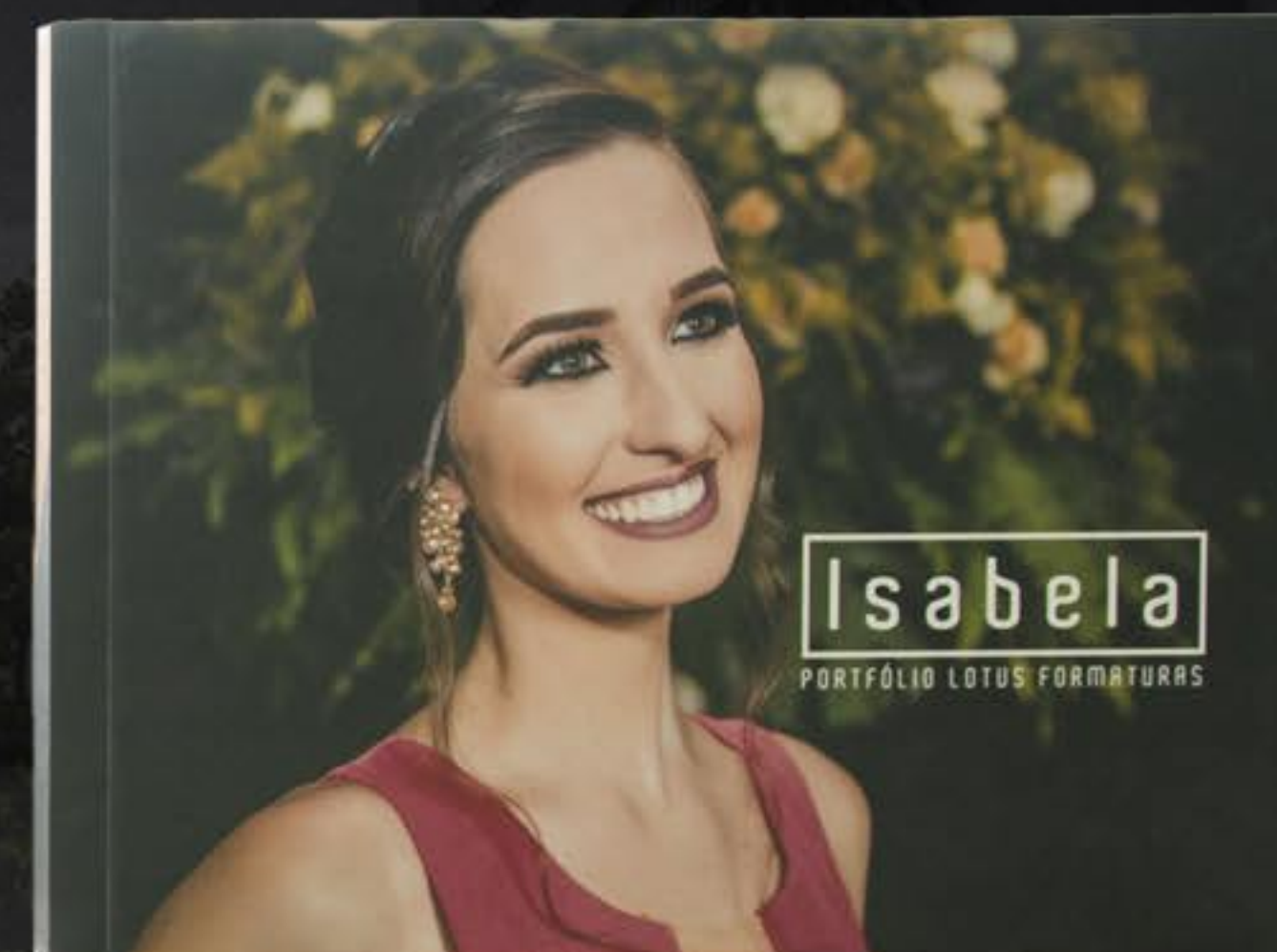
SUPERLUXO 30 X 80 CM (ABERTO) 30 X 40 CM (FECHADO)