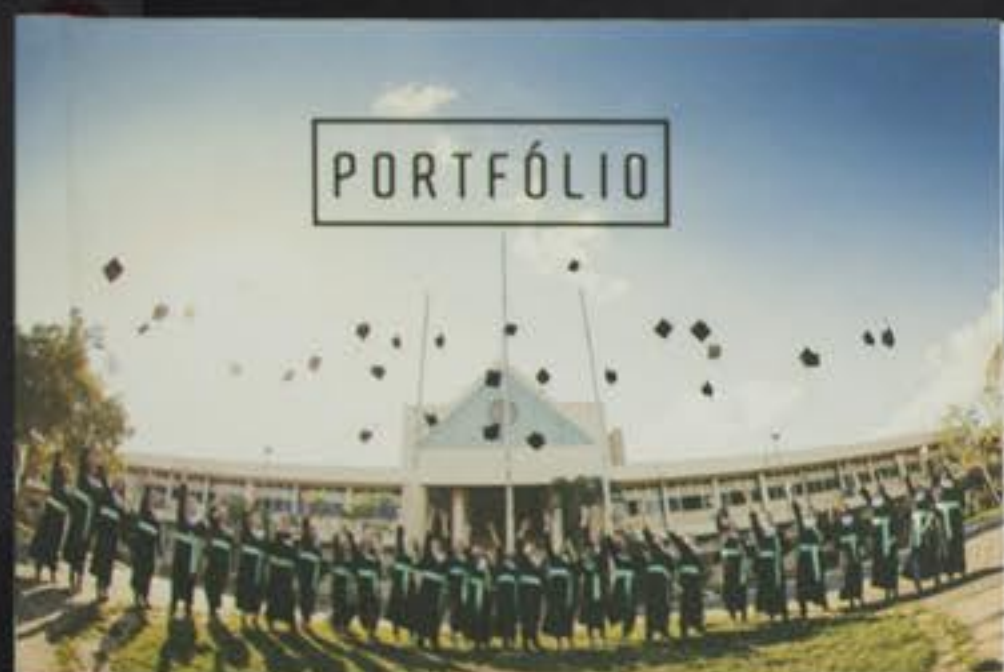
TRADICIONAL 20 X 60 CM (ABERTO) 20 X 30 CM (FECHADO)